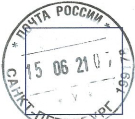
(оттиск КЛШ ОПС места приема почтового отправления)